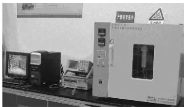
图1 SCMS-II型高温高压岩心多参数测量系统

试验仪器采用西南石油大学 SCMS-II 型高温高压岩心多参数测量系统,该测量系统可以进行低渗煤岩渗流应力敏感性试验。测试系统(如图1)由恒温加热的密闭箱、外部流量控制器及计算机数据采集和处理系统构成,通过高温高压夹持器密封测试岩心,围压温度控制系统作为夹持器的加压源提供可变压力,孔渗测量系统采用标准室内的气体降压速度来计算渗透率变化,最终由计算机完成对渗透率及有效应力测试数据的处理工作 [11] 。测试系统性能指标包括:温度范围为室温~150℃,围压和轴向压力1~90 MPa,误差范围±10%。应力敏感性试验流程图参见文献[12]。试验样品取自鄂尔多斯盆地东南缘老坑口矿井,试验煤心分别从平行面割理、垂直面割理和垂直层理面方向的煤岩上钻取,钻成的天然圆柱形煤心柱塞规格:直径2.5 cm,长度4~7 cm,煤心柱端部平整;试验测试气体为氦气。